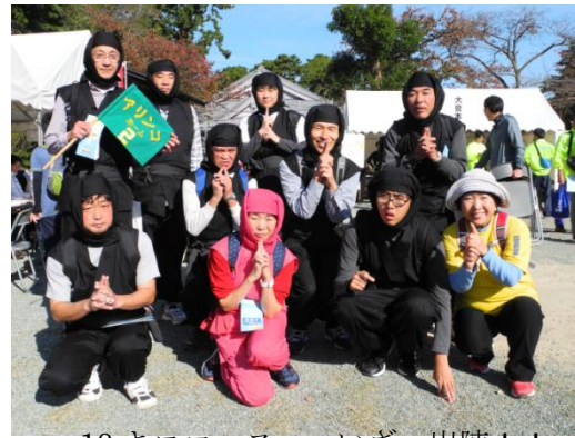
10キロコースへ いざっ出陣！！

全国ベスト5のウォーキング大会の11月17日（土）・18日（日）に行われたツーデーマーチの17日（土）に法人行事の「ウォークラリー」として参加しました。天候にも恵まれ10キロコース・6キロコース・法人オリジナルの特別コースに別れ歩きました。ウォーキングの方は、忍者衣装を着て歩き、メンバーやボランティアさん職員が、