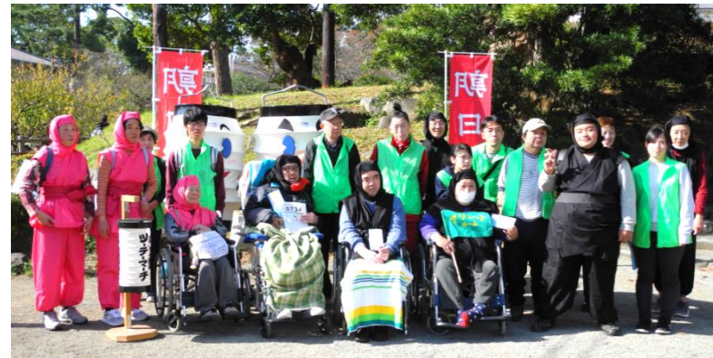
特別コースへ出発 がんばるぞ！！