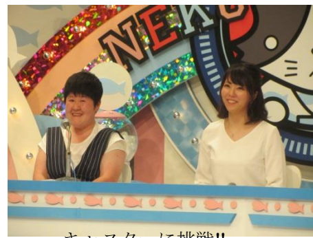
キャスターに挑戦!!

6月4日(月)今年もご招待いただき、利用者・職員合わせて10名が一緒に横浜市関内のTVKスタジオへおじゃましました。たくさんの人の中、最前列へ誘導され、TVKアナウンサーにより会がスタートしました。(テレビで見るより実物の方がかわいいです!)ポンパドール社長のマジックショー、Mさんが大好きなDガールズショー、元プロ野球巨人軍選手の榎原氏も一緒に進行役を務めた、