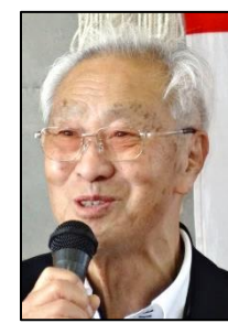
新玉地区連合自治会飯田会長