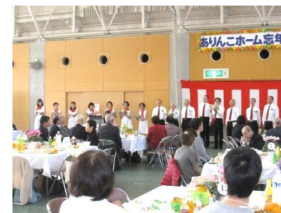
シグナス'94のみなさん