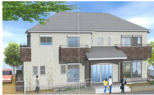
新グループホームの完成予想図

特定非営利活動法人「おだわら虹の会」に待望のグループホーム第2弾が今夏、鴨宮地区に開設されます。現行のグループホーム“すまいる”を開設してから早いもので約3年半が過ぎようとしています。この間、地域の皆様に応援して頂きながら、「地域の中で、地域と共に」をモットーに歩んでまいりました。建築するグループホームは、女性5名、男性5名、計10名の定員規模で1月26日の地鎮祭を皮切りに2月初旬から建築施工を開始し今夏の竣工を予定しております。