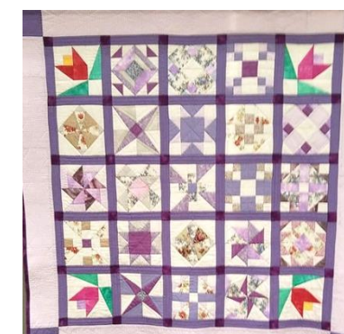
ありんこパッチワークエンジェル パッチワークタペストリー 「フレンドリー(ともだち)キルト」