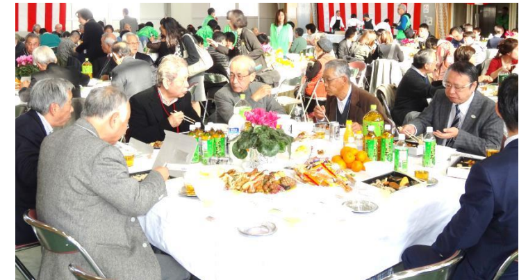
大勢の方々に参加下さいました

この「ありんこホーム忘年会」は日頃お世話になっているボランティアの皆様への感謝の意を表すとともに、地域の方々との交流を深め、お互いの1年の労をねぎらうために開催したものです。