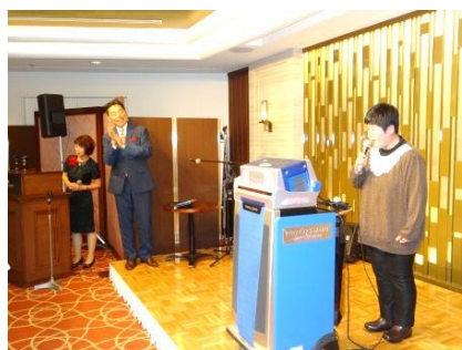
目慢ののどを披露!!

李税理士事務所主催のチャリティーXmasパーティーが12月5日に開催され、ありんこホームもご招待頂き、今回は10名で参加しました。