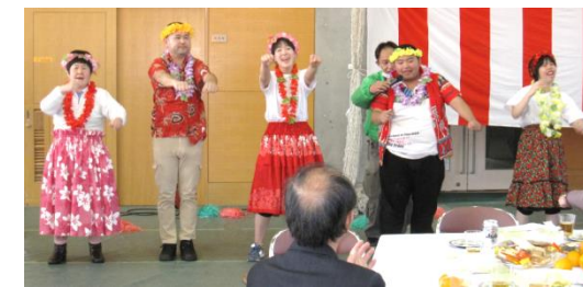
linoありんこによる創作ダンス