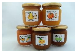
各種手作りジャム