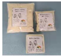
ありんこ（廃油）石鹸