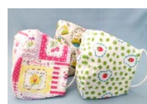
布製手作りマスク